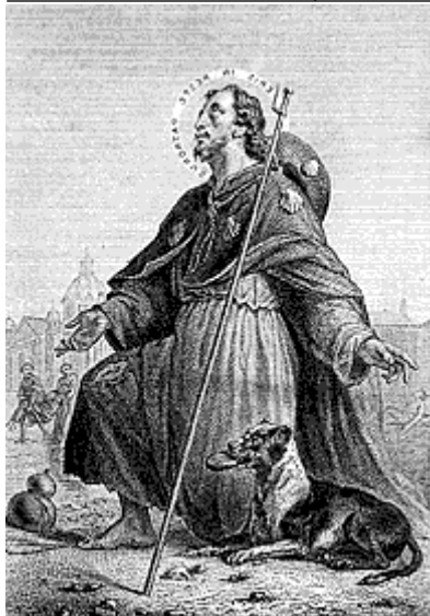
SAN ROQUE 1295 - 1327

Festividad: 16 de agosto Nacionalidad: francesa