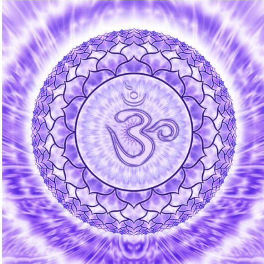
SAHASRARA (Multiplicado por mil)

SÉPTIMO (Centro de corona): Integración de la personalidad total con la vida y los aspectos espirituales de la humanidad.