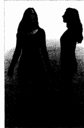
Imagen en color véase pág. 329

SITUACIÓN: aproximadamente en el centro del pie, señalando hacia abajo.