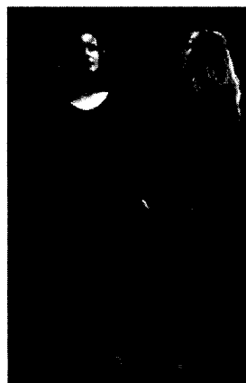
Imagen en color véase pág. 328