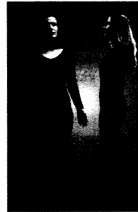
Imagen en color véase pág. 326