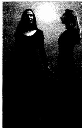
Imagen en color véase pág. 328

SITUACIÓN: sobre la frente, a medio camino entre el Tercer Ojo y el chakra corona.