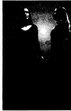
Imagen en color véase pág. 327