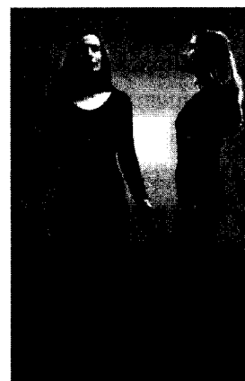
Imagen en color véase pág. 327