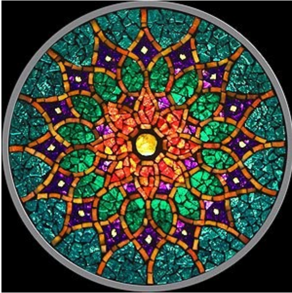
MANDALA COLOR VERDE