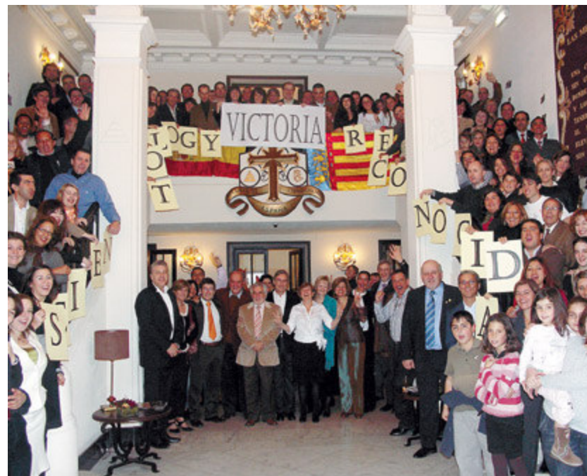
Simpatizantes y miembros de la Iglesia de la Cienciología celebran el reciente reconocimiento por la Audiencia Nacional.