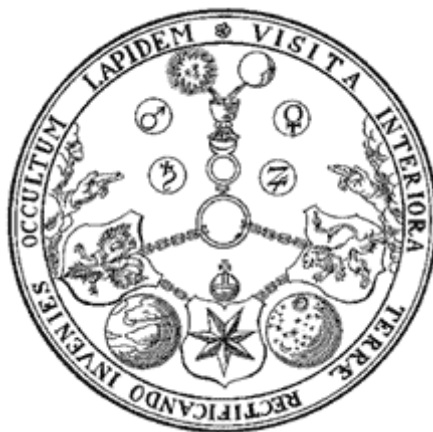
La Mesa de Esmeralda (Tabula Smaragdina)