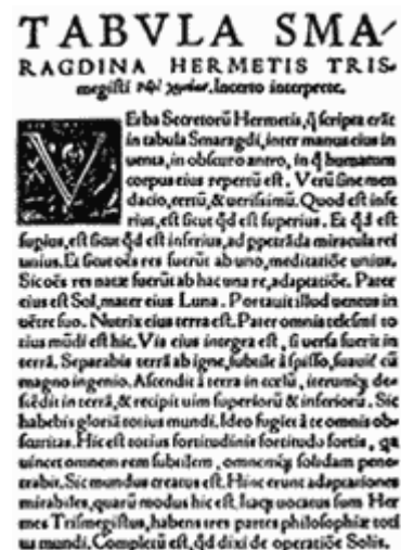
La Tabla de Esmeralda (Tabula Smaragdina)

Si la obtención de la piedra filosofal puede resultar de estos tres principios de transformación, existe una segunda teoría, la del azufre y el mercurio, basada en la purificación de los 4 elementos.