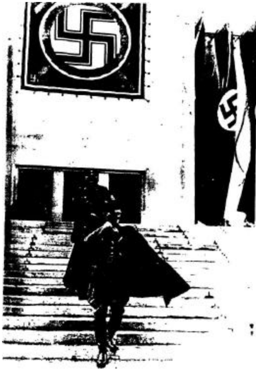
XXVII Hitler, el iniciado, en los mágicos Congresos de Nuremberg (Capítulo Hitler Gran Sacerdote de Occidente)