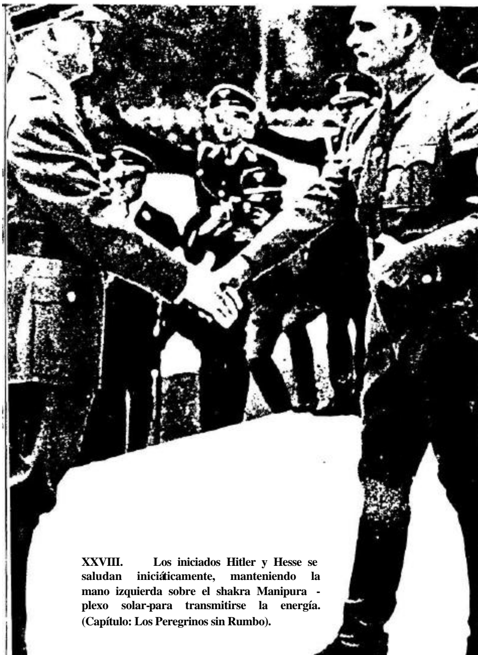
XXVIII. Los iniciados Hitler y Hesse se saludan iniciáticamente, manteniendo la mano izquierda sobre el shakra Manipura - plexo solar-para transmitirse la energía. (Capítulo: Los Peregrinos sin Rumbo).