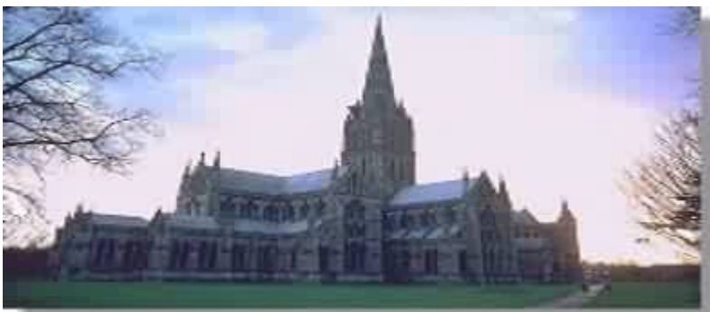
La Catedral de Salisbury

Por la especial relación con la Orden deberemos ocuparnos detenidamente del Templo del Rey Salomón (descripciones bíblicas, El Templo del Rey Salomón de E. Raymond Capt. Ed. Lidíum) y de las catedrales medievales.